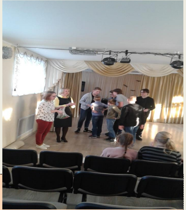
Вручение сладких призов победителям

22 февраля, мы праздновали День защитника Отечества. В этом году мы пригласили своих мальчишек – будущих воинов, поучаствовать в квесте «Непобедимая и легендарная». Так как 23 февраля было 100 лет создания Красной армии, то и вопросы на отдельных станциях были из истории страны, её Армии. Я была ответственной за проведение станции «Рождённая революцией». Ребята из всех команд, как мне показалось, участвовали в игре с большим интересом. Они старались найти правильные ответы на вопросы. Несмотря на то, что в командах были ученики из разных классов, они сумели договариваться между собой. В игре каждая команда добывала ключ к расшифровке слова на заключительном этапе игры. Выиграли ребята из двух команд, но проигравших точно не было.